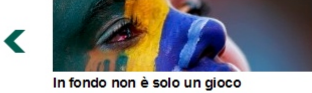
In fondo non è solo un gioco