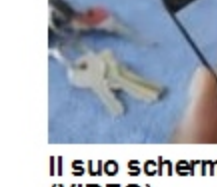
Il suo schermo (VIDEO)