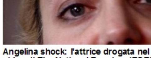
Angelina shock: l'attrice drogata nel video di The National Enquirer (FOTO)